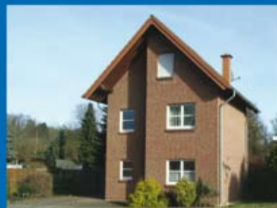
Einfamilienhaus (Objekt 70271) Kaufpreis: 192.000 € Käuferprovision: 3,570 %