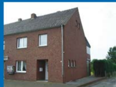
Doppelhaushälfte (Objekt 70290) Kaufpreis: 139.500 € Käuferprovision: 3,570 %