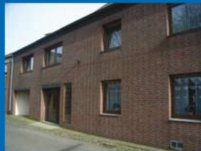
Reihenhaus (Objekt 70282) Kaufpreis: 129.000 € Käuferprovision: 3,570 %