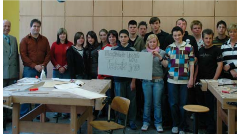
Die Schülerinnen der Hauptschule Linnich freuten sich über die großzügige Spende.