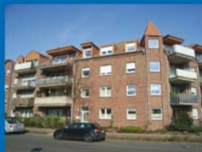
Eigentumswohnung (Objekt 70276) Kaufpreis: 129.000 € Käuferprovision: 3,570 %