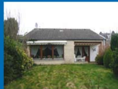
Bungalow (Objekt 70279) Kaufpreis: 129.500 € Käuferprovision: 3,570 %