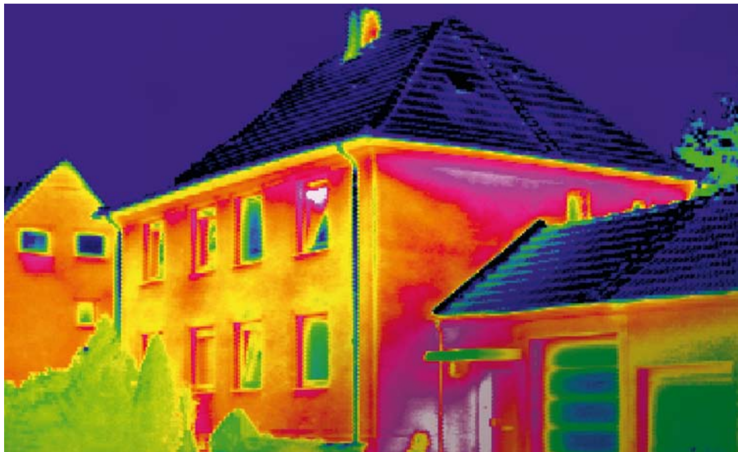
Das offizielle Kampagnenmotiv zum EnergieAusweis.

Erkelenz. Mehrmals wurde der Start verschoben, doch nun ist es so weit: Ab diesem Jahr müssen Gebäude sich – oder genauer: ihren Energiebedarf – ausweisen können. Der Energiepass wirft bei Bauherren, Hausbesitzern, Immobilienkäufern sowie bei Mietern und Vermietern aber auch viele Fragen auf: Wer braucht ihn und ab wann genau? Was kostet er und wo bekommt man ihn? Die Raiffeisenbank Erkelenz und ihr Verbundpartner, die Bausparkasse Schwäbisch Hall, beantworten die wichtigsten Fragen zum Energiepass.