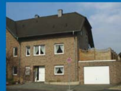
Doppelhaushälfte (Objekt 70285) Kaufpreis: 175.000 € Käuferprovision: 3,570 %