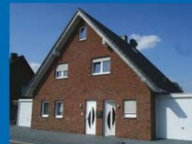
Einfamilienhaus (Objekt 70292) Kaufpreis: 208.000 € Käuferprovision: 3,570 %