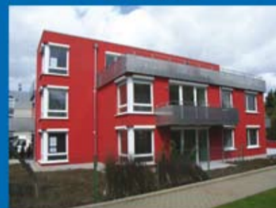
Eigentumswohnung (Objekt 70238) Kaufpreis: 147.500 €