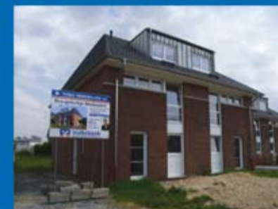
Doppelhaushälfte (Objekt 70224) Kaufpreis: 213.100 €